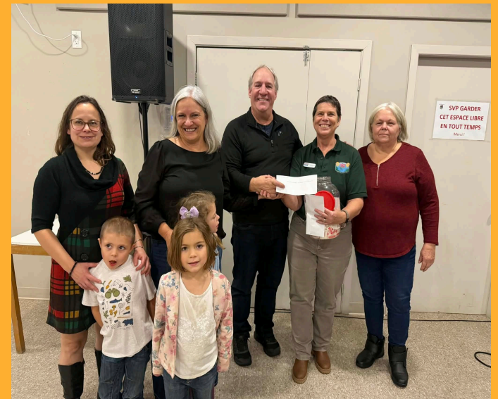
Le comité chasse et pêche de La Minerve