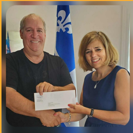
Chantale Jeannotte, députée de Labelle