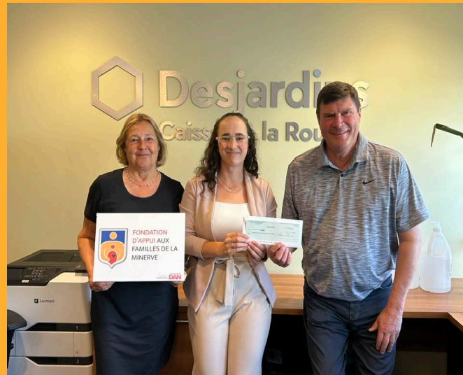
Caisse Desjardins de la Rouge