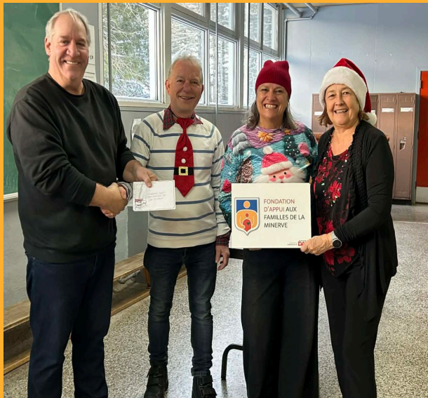
Le Club quad Iroquois