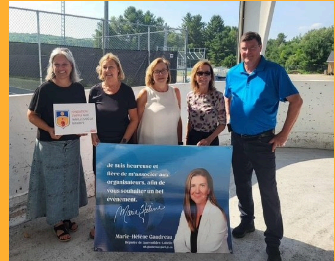
Marie-Hélène Gaudreau, députée de Laurentides-Labelle